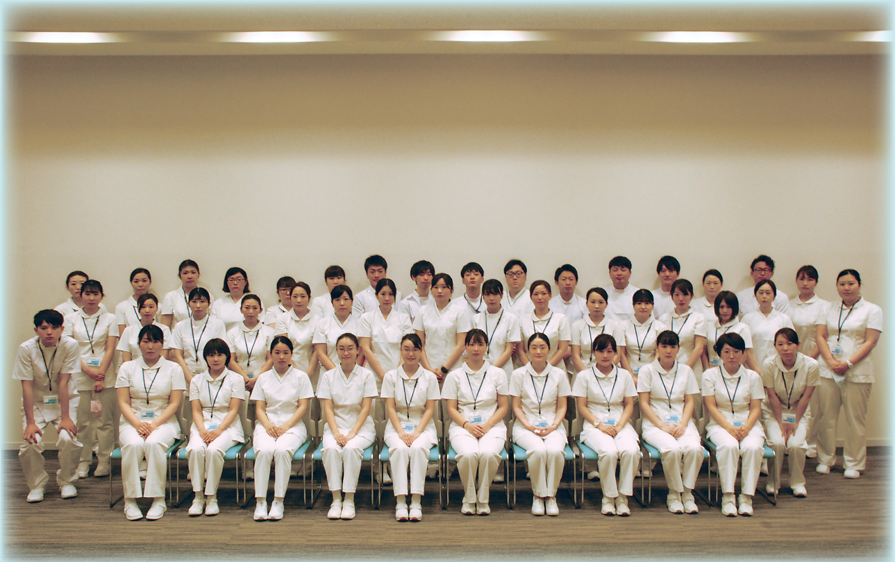
つがる西北五広域連合に新たに入職した皆さん