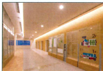
■ 1F 正面玄関・ホワイエ