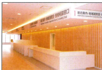
■ 2F 医事課窓口