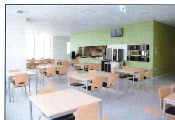
■ 2F レストラン