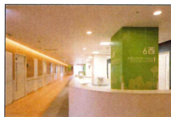
■ 5F~9F 病棟スタッフステーション